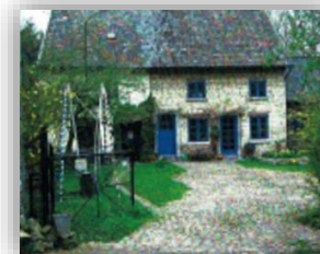
Achterde Auw Kapel Oud Lemiers