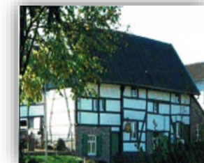
A jen Èng tussen Mamelis en Lemiers