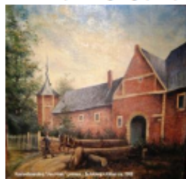
Kasteelhoeve Jen Hoes naar een schilderij van Killian ca. 1900 met brug over kasteelgracht en links de 8-hoekige toren die in de oorlog WO II is verwoest.

(16) Vanaf het kasteel loopt u de verharde weg terug richting Lemiers. Na een min. of 3 bent u dan weer bij de kerk van Lemiers (het uitgangspunt) aangekomen.